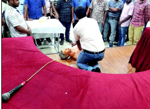
বিহার সিস হ্যাণ্ডলারের অডিটরিয়ামে আলিউটেড রিলিক ট্রেন, এপিআরএমডিও ১৪০ টনের বিডি স্কেন গিয়ার ৩০ দিনের মাফে এই প্রদর্শন কর্মসূচির আয়োজন করা হয়েছিল।

গণ ক্রয়, ২০২২ তারিখে সমগ্ন ত্রৈমাসিকের আর্থিক ফল প্রকাশ করল পিএনবি।